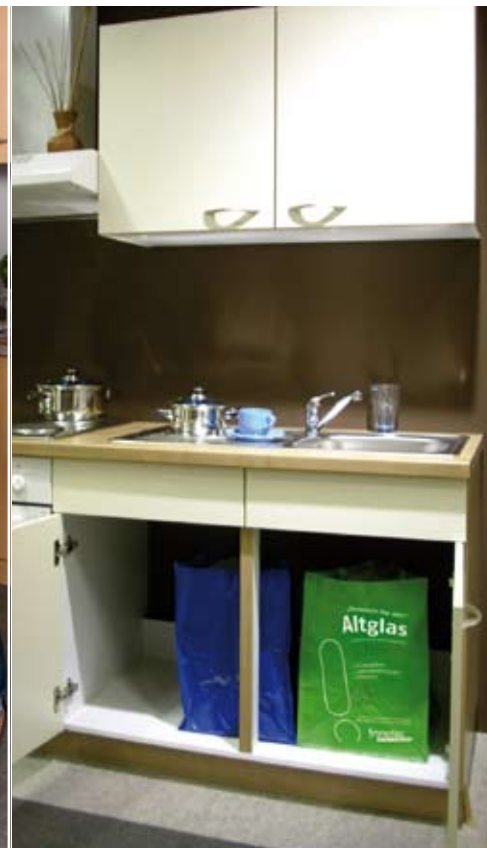
handlich, leicht und vielseitig einsetzbar: Wertstoffsammeltaschen