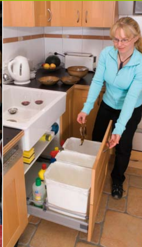
Übersichtlich trennen, dort wo Müll anfällt