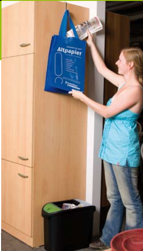
Zu Fuß und auf Augenhöhe: schmale Lösungen für jede Küche